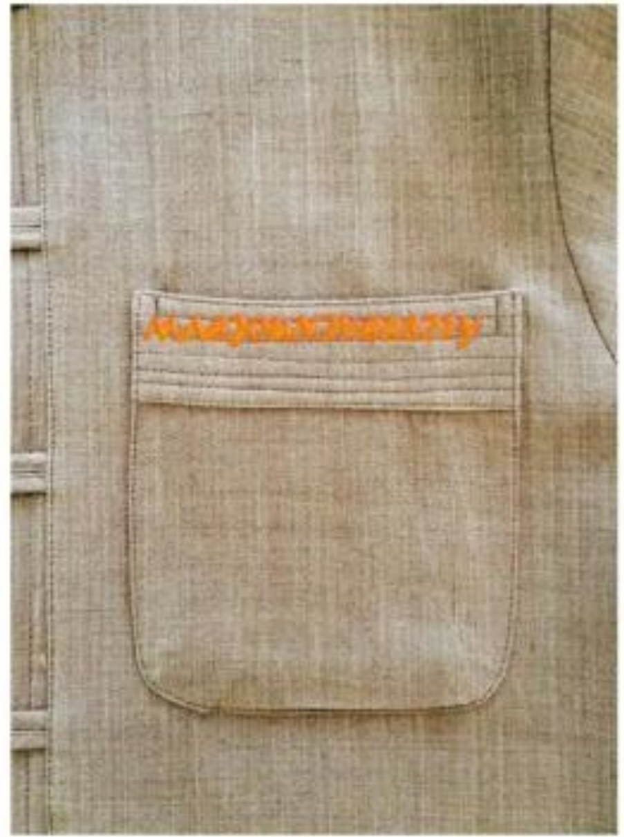
“มหาวิทยาลัยชั้นนำที่มีความเป็นเลิศทางการเกษตรในระดับนานาชาติ”