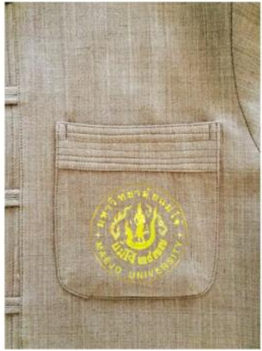
“มหาวิทยาลัยชั้นนำที่มีความเป็นเลิศทางการเกษตรในระดับนานาชาติ”