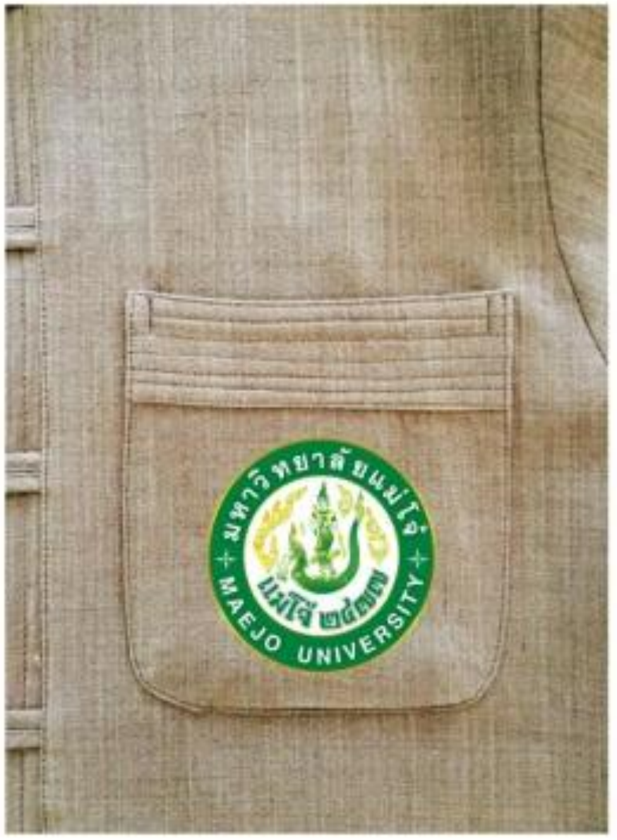
“มหาวิทยาลัยชั้นนำที่มีความเป็นเลิศทางการเกษตรในระดับนานาชาติ”