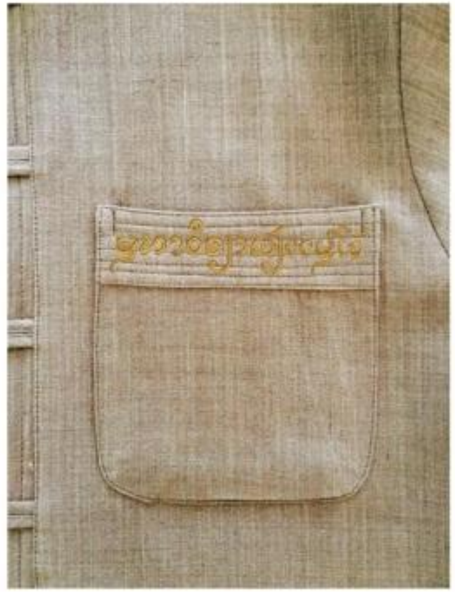
“มหาวิทยาลัยชั้นนำที่มีความเป็นเลิศทางการเกษตรในระดับนานาชาติ”