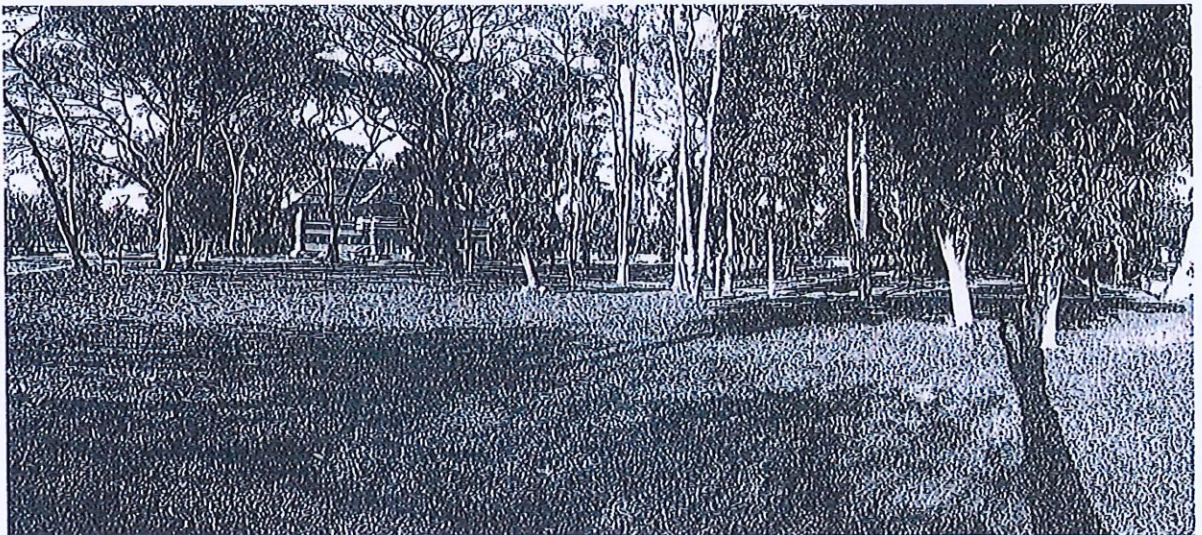
ภาพประกอบพื้นที่บริเวณหน้าอาคารเรือนธรรมแม่โจ้ 60 ปี มหาวิทยาลัยแม่โจ้